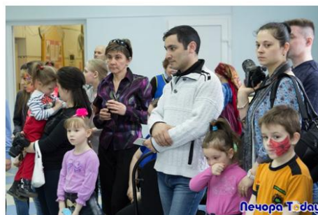
Выпускники нашей школы с детьми — нынешними учениками.

Очередную «БиблиоНочь» для активных и творческих печорцев провели в минувшую пятницу сотрудники Центральной библиотеки. Ее тема на этот раз так и называлась «Энергия творчества».