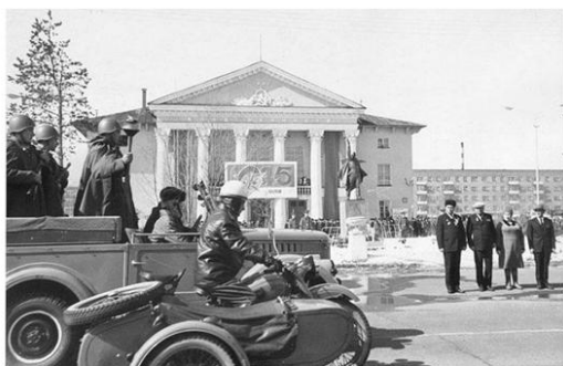
Парад 9 мая, Площадь Победы. 1970-ые годы