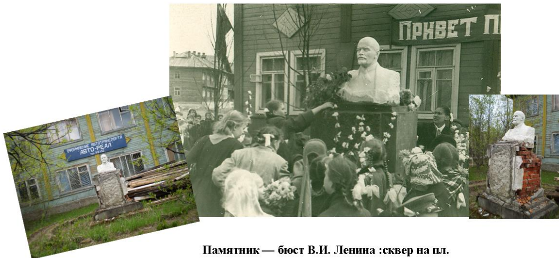
Памятник — бюст В.И. Ленина :сквер на пл.