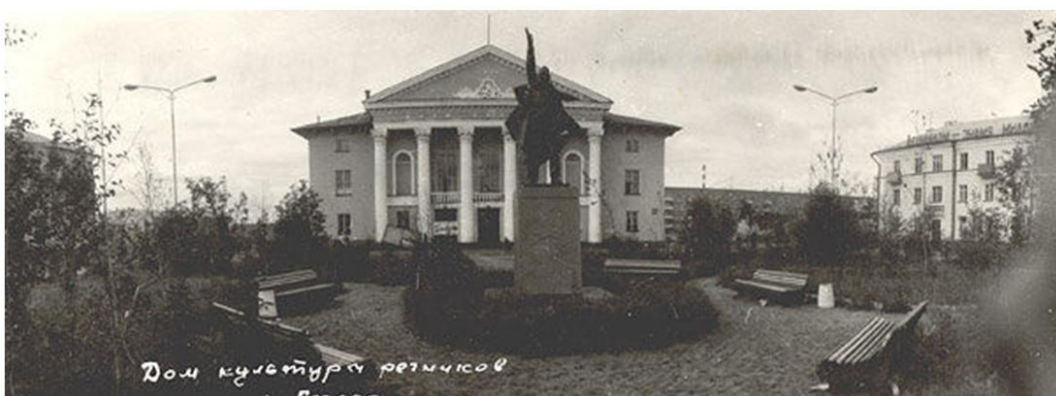
Площадь Победы,памятник воину освободителю, 60-е годы