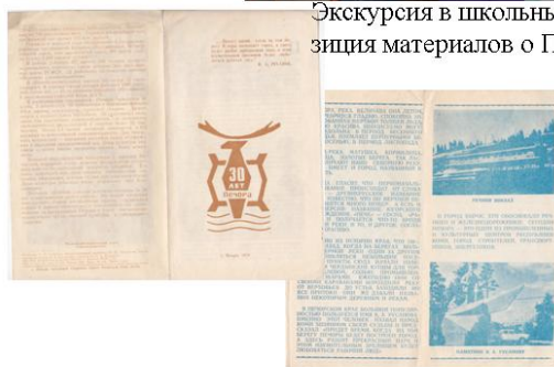
Экскурсия в школьный музей: экспозиция материалов о Печоре.