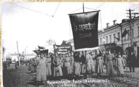
Первомайская демонстрация 1917 год г. Псков

Школьный калейдоскоп, № 9 (82) май 2016 МОУ «СОШ №49» г.Печора Над выпуском работали: пресс-группа ДО «Вирус», рук.: Людьягина Д.В. Тираж—20 экз.