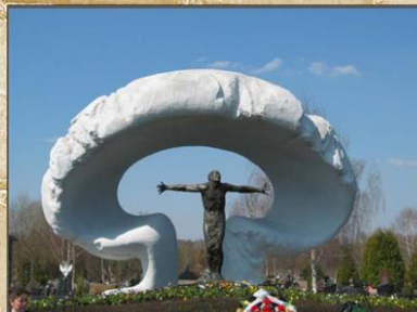
Мемориал первым жертвам Чернобыля в Москве

Эта дата появилась в официальном календаре спустя 26 лет после аварии на Чернобыльской АЭС, печально известной на весь мир. 26 апреля 1986 года на четвертом энергоблоке Чернобыльской атомной электростанции произошел взрыв. В результате был полностью разрушен реактор, в окружающую среду попало огромное количество радиоактивных веществ. Образовавшееся облако разнесло радионуклиды по большей части территории Европы и Советского Сою- за. Непосредственно во время взрыва погиб один человек, еще один скончался утром. Однако впоследствии у 134 сотрудников Чернобыльской АЭС и спасательных команд развилась лучевая болезнь, и 28 из них умерли в течение следующих месяцев. В феврале 2006 года Генеральная Ассамблея ООН предложила отмечать 26 апреля как Международный день памяти жертв радиационных аварий и катастроф, а также проводить памятные мероприятия. 4 апреля 2012 года президент России Дмитрий Медведев утвердил изменения в закон «О днях воинской славы и памятных датах России». Название было изменено с той целью, чтобы не только чтить память погибших, но и чествовать ныне живущих ликвидаторов. Речь идет не только о ликвидаторах- чернобыльцах, но также о ликвидаторах последствий аварий на НПО «Маяк», на Семипалатинском полигоне и на Новой Земле.