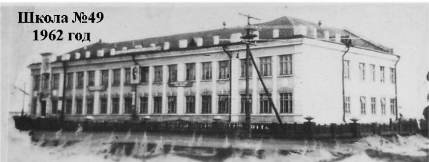
Школа №49 1962 год