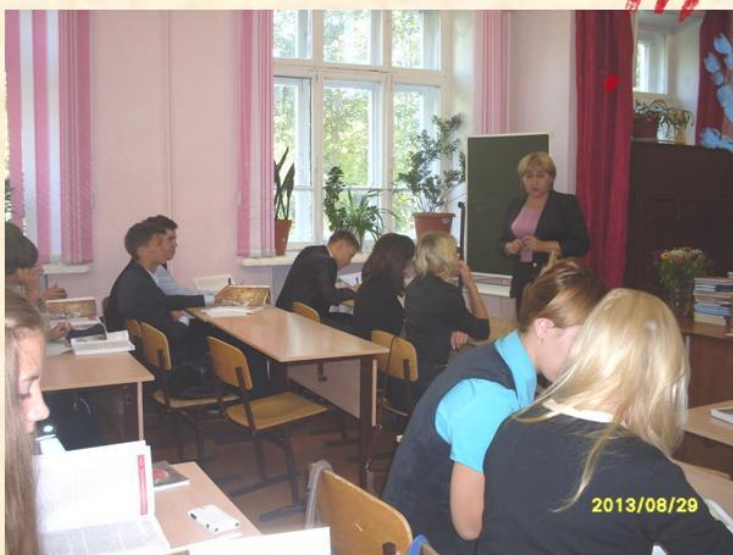
У 11 класса свои заботы...