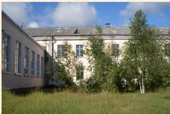
Учителя к новому учебному году готовы