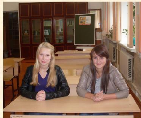
Наши выпускники про школу не забывают