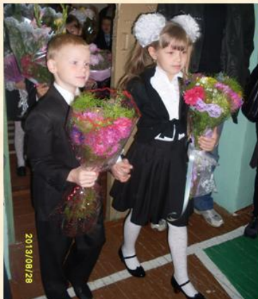
Букет для первой учительницы