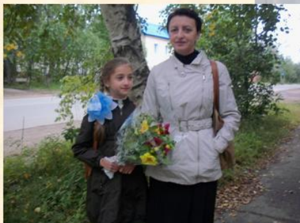
Уже в пятом!