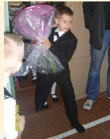
К знаниям—со всех ног!