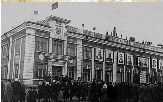
Здание Управления Печорлага, 1 мая 1956г.