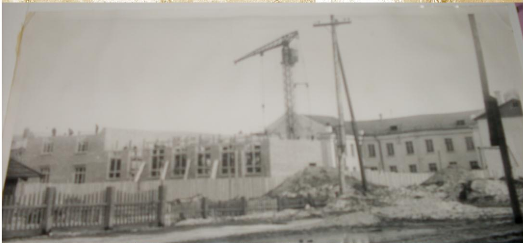
Строительство пристройки со спортзалом, 1959 г.