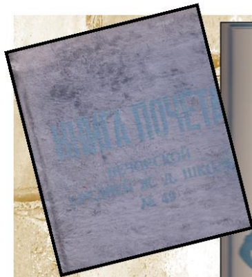
КНИГА ПОЧЁТА школы №49