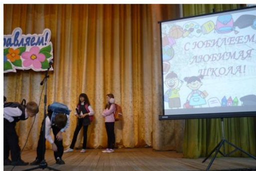
55-летие школы. 11 ноября 2012