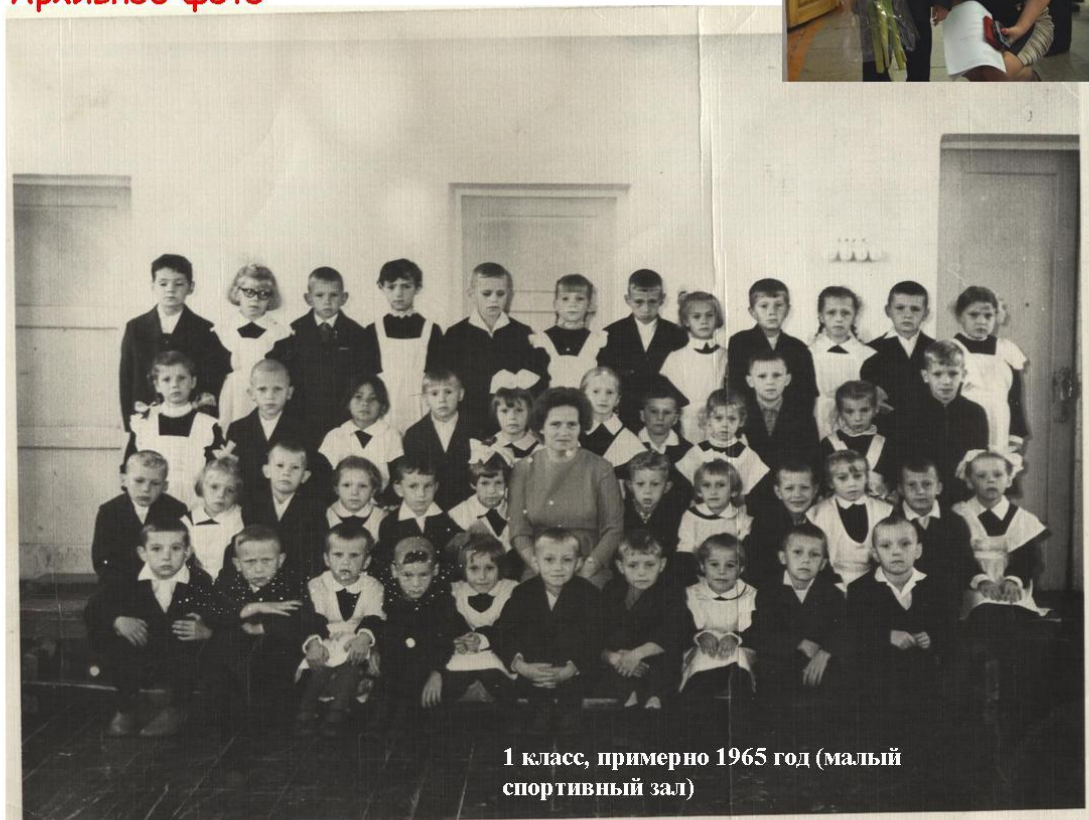
1 класс, примерно 1965 год (малый спортивный зал)