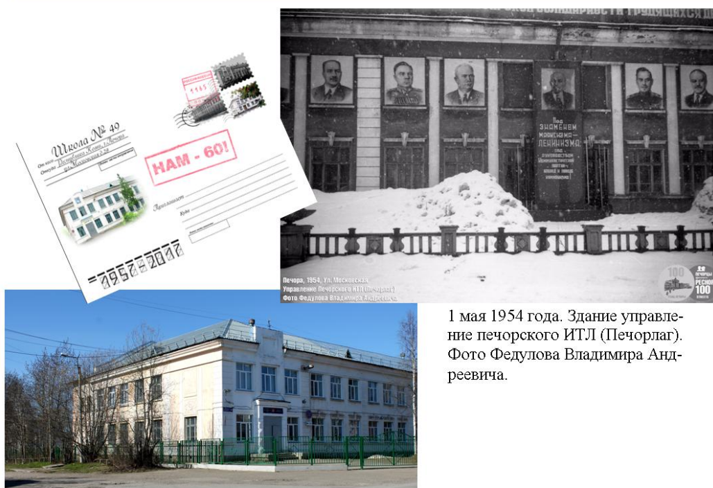
1 мая 1954 года. Здание управление печорского ИТЛ (Печорлаг).

В мае 2017 стены родной школы покинул юбилейный, 50-й выпуск.